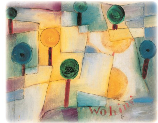
(Wohin? - Dove? - Paul Klee, 1920)

codice dell'evento ASUIUD 18016 per il 1 febbraio e 18038 per il 2 febbraio